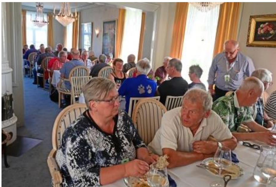
Trevligt samspråk på Voxna herrgård på lördagskvällen.

Etableringen var en process som rörde sig om flera olika moment som nedsättning, tillstånd, insynning, uppodling, skattläggning, registrering i jordebok och eventuell skatteinlösen. I regel skattlades de skogsfinska nybyggerna i området enligt ortens gängse skattenivåer etc. Men bosättningarna i Ore, Orsa och Rättvik skattlades inte utan skulle leverera ett visst antal tunnor råg till kronan. Detta fick till följd att deras förhållande till bruken skulle präglas av tvister om besittningsrätten.