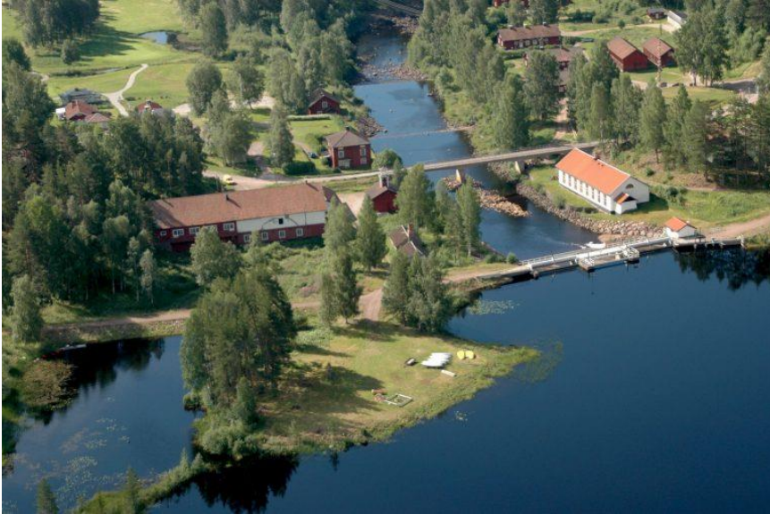
Furudals bruk

Årets vårkonferens har hållits i vackra Ore, närmare bestämt vid Furudals bruk. Konferensen hade rönt ett överväldigande intresse och ett 70-tal deltagare hade mött upp vid inledningen av konferensen.