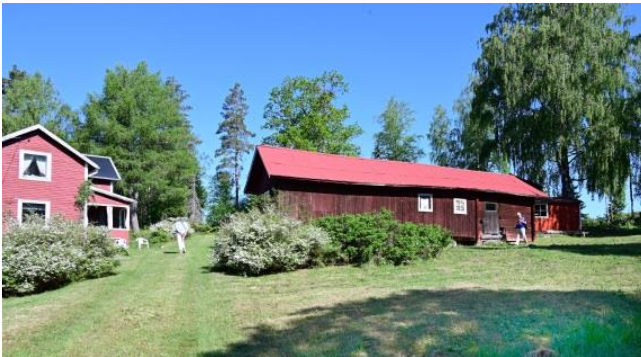
Gården Högstret vid Finsthögst

Nästa stopp var Korsåsen upptagen av Mickel Persson på 1600-talet, där vi lämnade bussen för en längre vandring i terrängen. Härjedalsbördige Håkan Kristoffersson berättade på klingande Långåmål om Sveaskogs insatser i området med avverkning och följande röjning av skogen till ett öppet landskap med övervägande lövskog. Området, "en kulturskatt utan dess like", omfattar nära 20 hektar och man har funnit ca 200 lämningar av mänsklig aktivitet. Vi kunde se ruiner, källare, brunnar odlingsrösen, odlingsterasser mm. Även floran har förändrats genom uppväxande ängsörter.