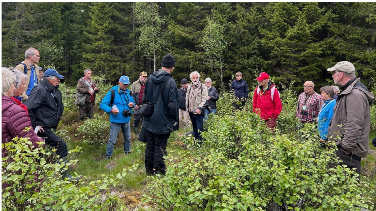
En bit högre upp fanns stenrester som man inte vet så mycket om.