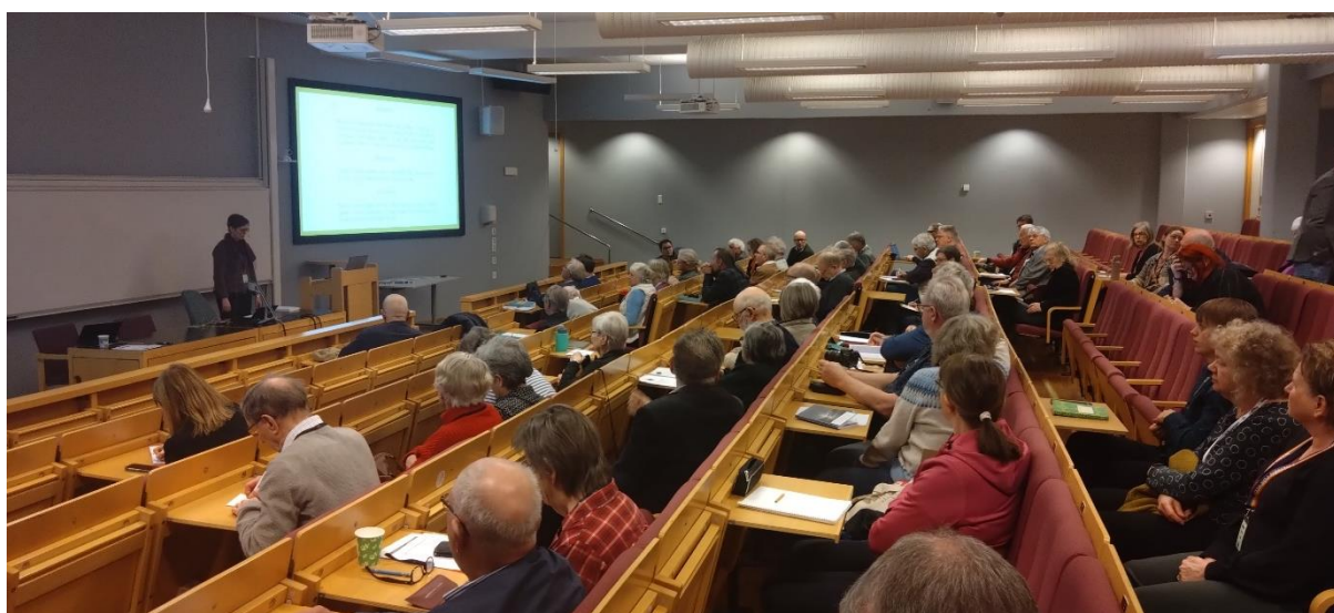
Hörsalen på Karlstads universitet var stor och rymlig.