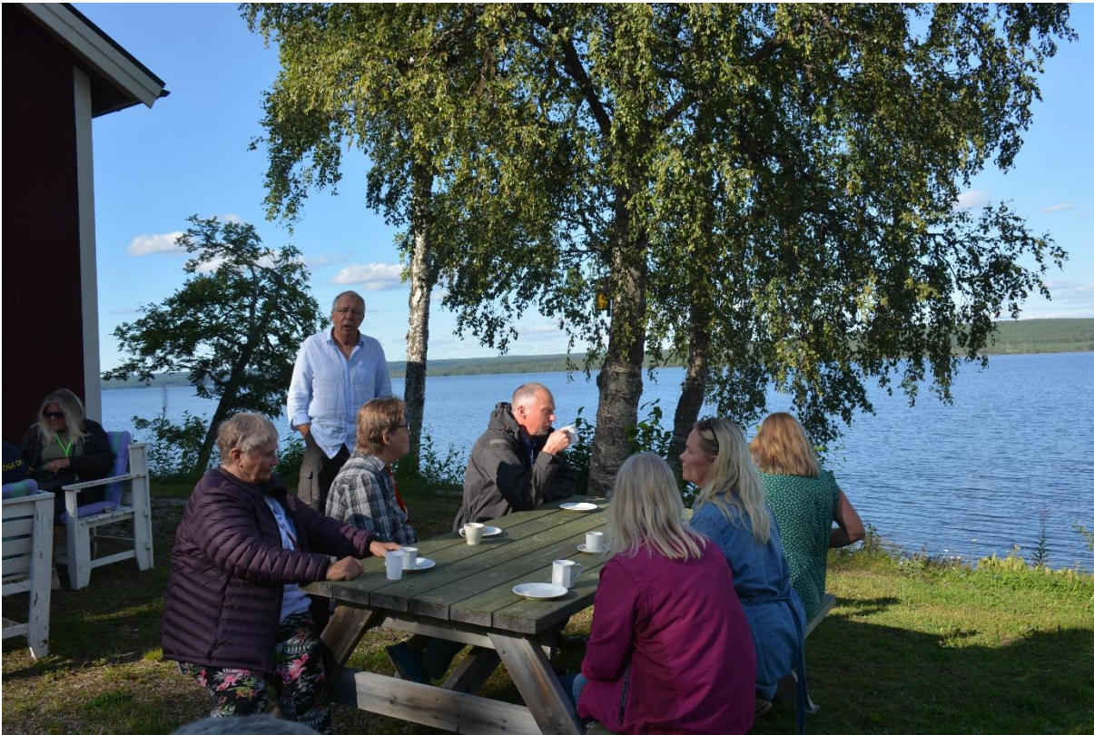
Kaffestund vid Skeppargården i Alanäs.