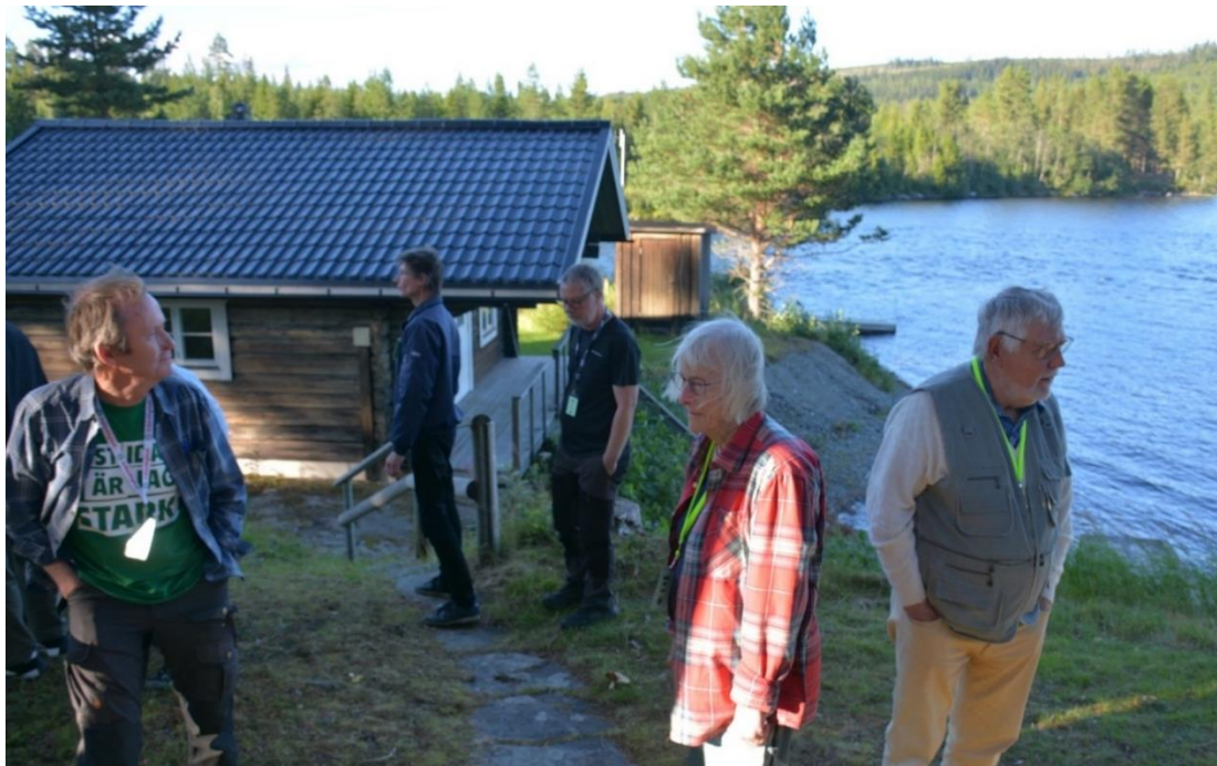
Vi befinner oss i Hillsand.