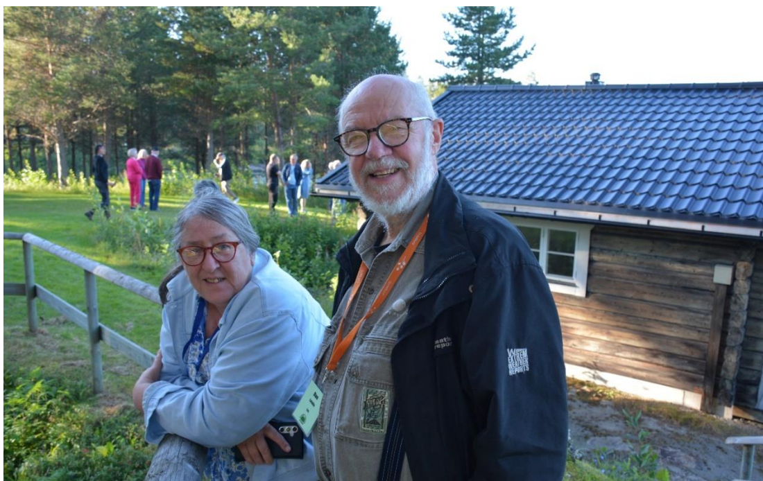
Två glada ättlingar till slakten Tossavainen på besök i Bågede.

Tillbaka igen via Gubbhögen, och så norrut mot Lidsjöberg och Bågede. Nu befann vi oss i Ströms vattudal. Färden gick söderut förbi Svaningen till Hillsand. Här bodde finnar från 1669, men de första