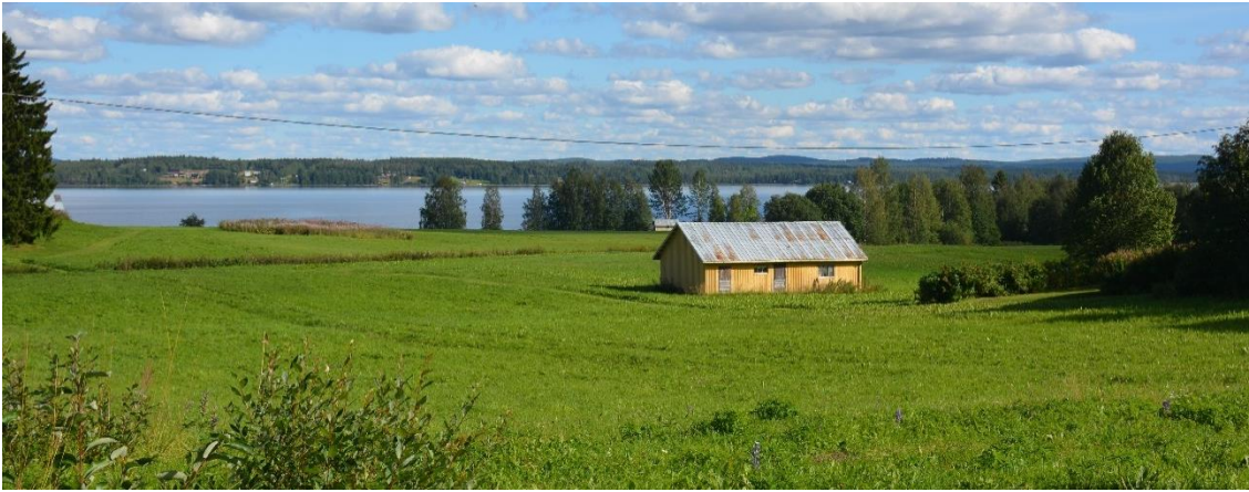
Nere vid sjön i Havsnäs låg den första bosättningen.