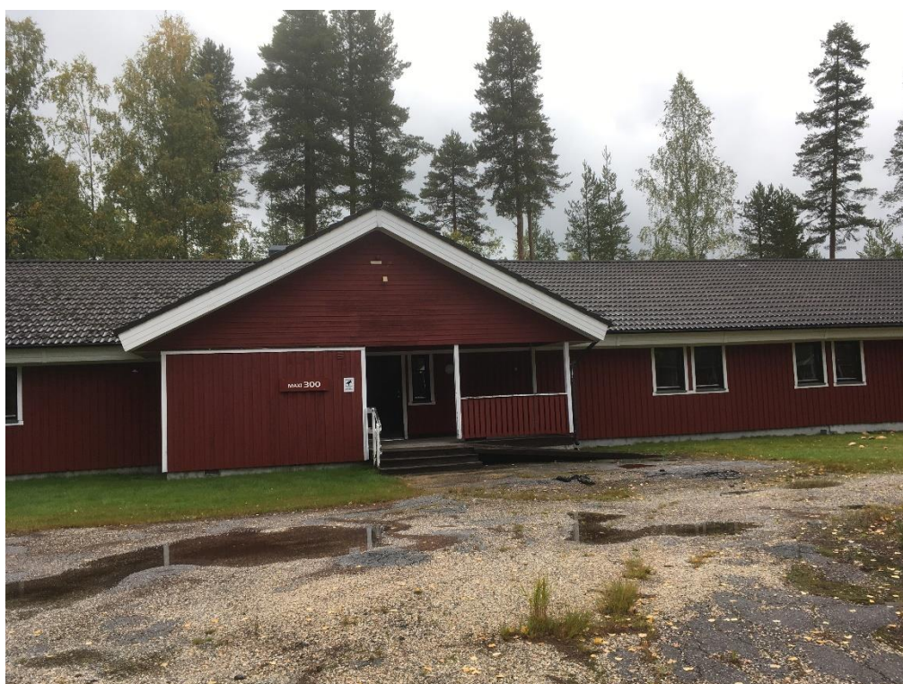
Maxistuga vid Hassela Ski Resort

Drygt 60 deltagare samlades på Hasselagården. Ungefär hälften kom från närområdet, eller hade ordnat eget boende. Vi övriga inkvarterades på Hassela Ski Resort i två ”Maxistugor” som erbjöd enkelt men trivsamt boende i god FINNSAM-stil. Frukost serverades i ett kök/allrum i den ena stugan, som på kvällarna användes för ”trevlig samvaro”.