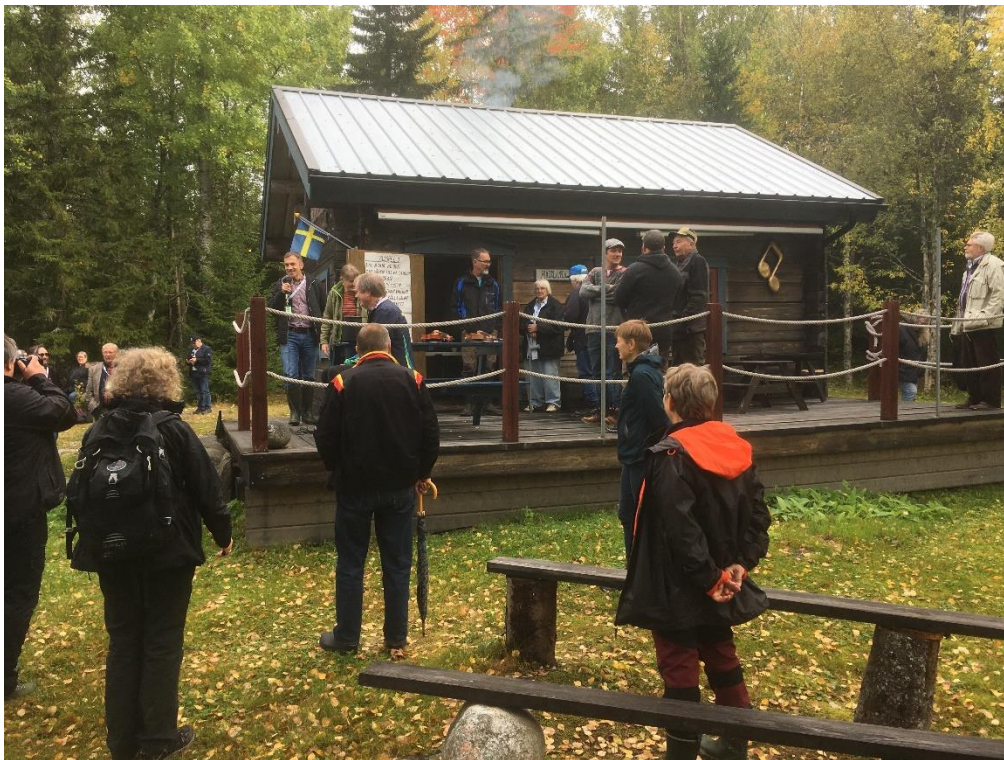
Vid Hultkläppens renoverade stuga.

Några av oss gick vidare längre uppåt, till den minnessten som står på den verkliga platsen för den stuga där Hultkläppen bodde 1878-1898.