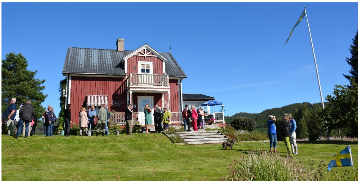
Även i Rörström skiner solen från en klarblå himmel.

I Rörström bjuder så hembygdsföreningen på jämtländska stutar, dvs mjuka tunnbröd med god fyllning. Vi besöker platsen för den första finnbosättningen. Den 25 mil långa färden avslutas med ett stopp i Rudsjö, lika fagert beläget som de andra platserna. Mycket nöjda och belåtna och försedda med en stor portion intryck efter två innehållsrika dagar med buss genom Flåsjöbygden, Ströms vattudal och längs Tåsjön återvände vi så till Strömsund.