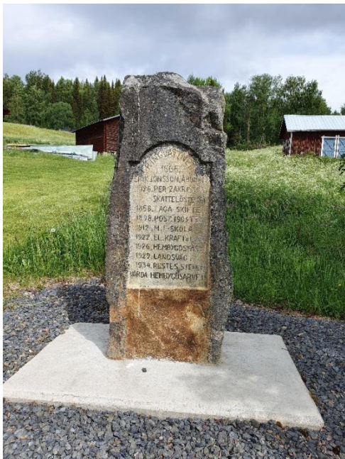
Minnessten i Ringvattnet